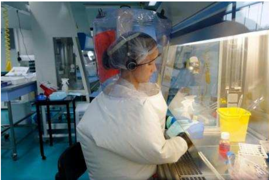
Laboratoire P4 Mérieux-Inserm

Le laboratoire P4 Jean Mérieux-Inserm est un laboratoire de haut confinement dédié à l'étude des agents pathogènes de classe 4 . Le niveau de sécurité biologique qui y est appliqué est de 4, niveau le plus élevé. C'est le seul endroit en France où les scientifiques sont autorisés à manipuler des échantillons contenant le virus Ebola.