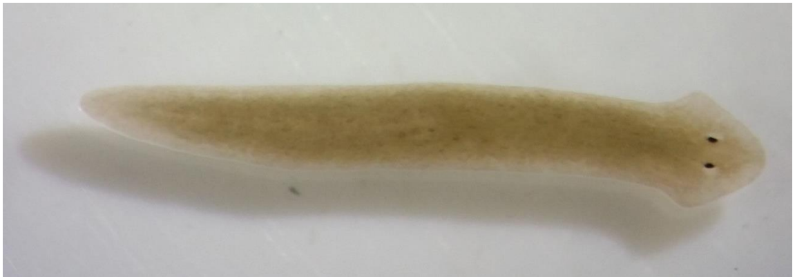
Dugesia japonica , le planaire sur lequel ont travaillé les chercheurs pour cette étude.