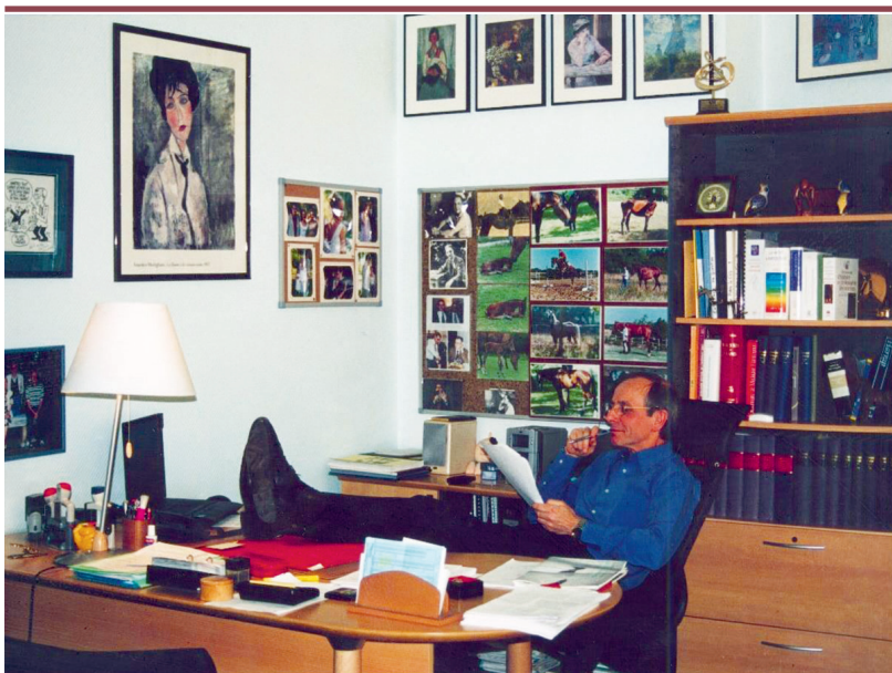
Axel Kahn dans son bureau de la direction de l'Institut Cochin (2002-2007).

ragea à multiplier les modèles murins de maladies humaines, premier palier indispensable avant de proposer un essai clinique rigoureux, mais très vite, malgré les succès sur la souris, il déclara que ce type d'approche aurait probablement plus de débouchés dans des affections non génétiques. Or à ce jour, 65 % des indications visées par les essais cliniques déclarés de thérapie génique touchent des affections cancéreuses et, encore aujourd'hui, on peut se rendre compte que les espoirs suscités par cette approche pour les maladies génétiques sont à la hauteur des déceptions qu'elle engendre [30]. Le dernier article qu'Axel Kahn ait publié dans m/s sur la thérapie génique date de 2007, alors qu'il n'en était plus le rédacteur en chef depuis dix ans, juste avant qu'il ne quitte la direction de l'Institut Cochin pour la présidence de l'Université René Descartes. Il porte sur le traitement d'une maladie génétique effroyable, l'épidermolyse bulleuse [31]. Il avait probablement estimé le résultat suffisamment prometteur pour reprendre la plume et le style de m/s et en écrire une nouvelle... Curiosité encore, curiosité toujours...