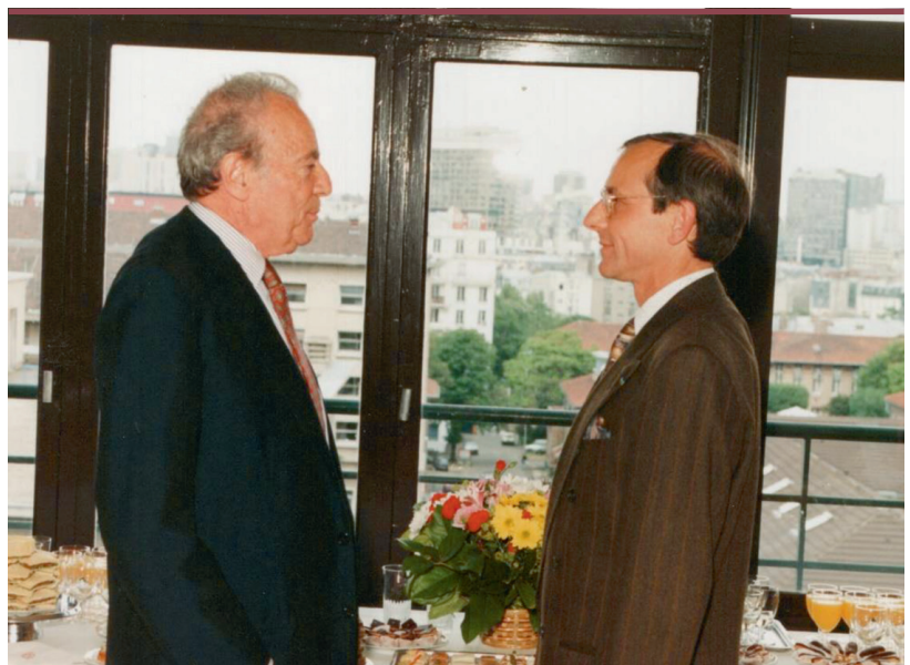
Axel Kahn décoré chevalier de la Légion d'honneur en 1995 par François Jacob.

Certes, étant issu de l'école des Schapira et Dreyfus, rompu à la génétique moléculaire, Axel nous encou-