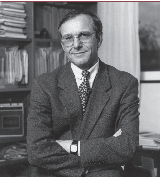
Axel Kahn (1944-2021).

Membre du Comité de rédaction de m/s depuis 1998 Chercheuse puis Directrice de recherche dans l'unité Inserm dirigée par Axel Kahn (1992-2008)