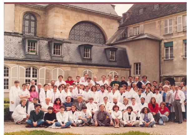
Les personnels de l'Institut de pathologie moléculaire réunis dans le cloître de la faculté de médecine Cochin-Port Royal en 1989.