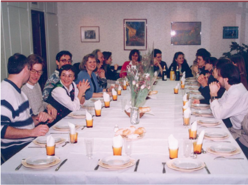
Repas post-séminaire dans la salle de conférence du dernier étage de la faculté de médecine Cochin.