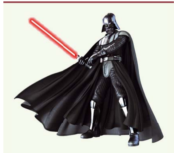
Figure 1. Dark Vader. Homme augmenté (© Render by Jonathan Rey).

de la cellule adulte ayant permis l'obtention de l'iPS. Toutefois de très nombreuses équipes de recherche travaillent sur ce sujet [12].