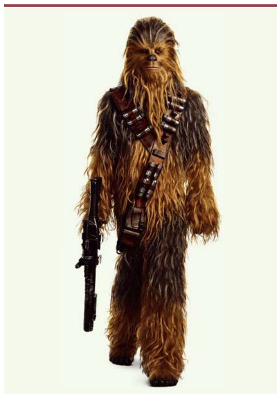
Figure 3. Chewbacca. Homme chimère.

L'heure actuelle, il est interdit de laisser se développer le fœtus au-delà du tiers de la gestation, ceci afin d'éviter la naissance d'animaux chimères homme/porc. Mais s'il est possible de générer des cœurs humanisés qu'il est possible de greffer, on peut penser que cette interdiction pourrait être remise en question, et Chewbacca ne serait plus alors de la science-fiction [26]. Mais est-ce qu'une chimère homme/animal serait une personne humaine ? À partir de quel pourcentage de cellules humaines doit-on parler de personne humaine ? Ou d'animal ?